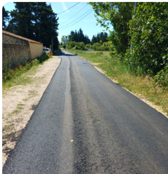
Un billard ? Non, le chemin de Saint Hilaire refait.

Il y a quelques semaines, le Maire a validé la réfection d'une partie du chemin de Saint Hilaire conjointement avec le Canal de Carpentras, qui devait reprendre des canalisations. Ce sont près de 2 km de routes de campagne qui ont été refaits.