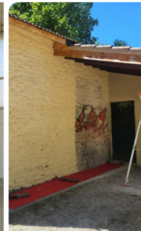
La maisonnette est en cours de nettoyage. La différence entre les deux parties est bien visible.