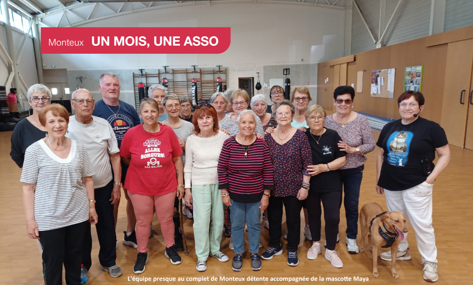
L'équipe presque au complet de Monteux détente accompagnée de la mascotte Maya