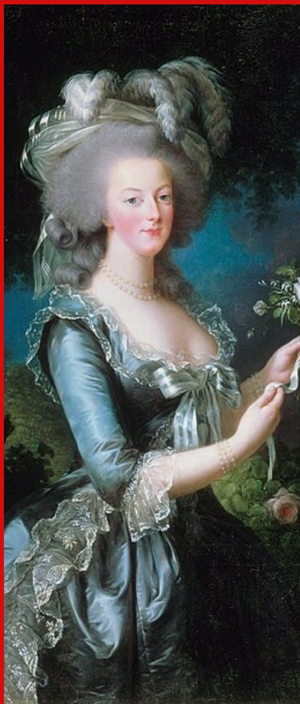
Portrait de Marie-Antoinette à la rose 1783, Élisabeth Vigée Le Brun

La Micro-Folie propose également des ateliers créatifs à la demande.