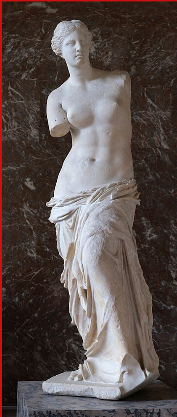
La Vénus de Milo vers 150-130 av. J.-C.