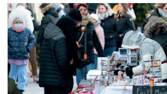
Tout au long de la Traversée des Arts , les ateliers ont ouvert leurs portes et un marché des créateurs s'est installé pour proposer des idées cadeaux originales et fabriquées artisanalement. Jolies lumières, créativité, les passants ont pu découvrir l'inspiration des artistes et artisans pour se plonger dans un univers créatif pour les fêtes.