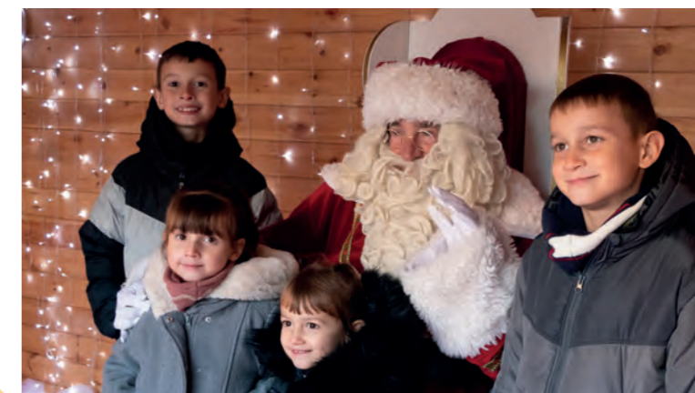
Le Père Noël a accueilli les petits Montiliens pour écouter leur liste de cadeaux et faire des photos.