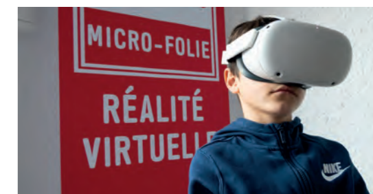
La Micro-Folie Monteux était également de la partie : la Réalité Virtuelle a eu beaucoup de succès ! Pour l'événement, une sélection de documentaires sur les fêtes a été proposée. Tout au long de l'année, la Micro-Folie c'est des milliers d'œuvres à portée de vue des Montiliens grâce au Musée numérique et l'entrée est gratuite ! Programmation et infos : monteux.fr

Malgré le vent fort et le froid glacial, les plus courageux ont participé à la parade du samedi soir et aux animations de rues avec des personnages tout doux et rigolos !