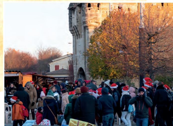
L'esprit des fêtes de fin d'année, c'est aussi de se faire plaisir. Cadeaux, gourmandises, jolis chalets en bois, décorations de Noël... Flâner dans les allées du Marché de Noël c'est entrer dans l'ambiance des fêtes de fin d'année !